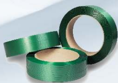
PET páska UNITAPE od výrobce UNIPACK