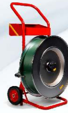
Robustní odvíječ vázací pásky H84T