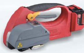
Ekonomický AKU páskovač H45L- spojení pásky svárem