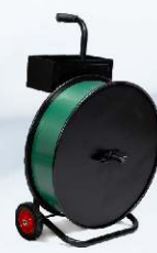
Odvíječ pásky H84 pro dutinku 200 i 406 mm