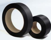
PP páska UNITAPE od výrobce UNIPACK