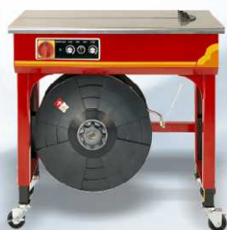
TP-502 s technologií 24 V, pro úzkou pásku šířky 5-13mm, síla utažení 8-45 kg