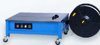
TP-202L - snížená verze stroje pro těžké a objemné produkty