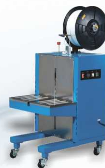
TP-201Y - boční agregát TP-201YS - nerezová verze stroje