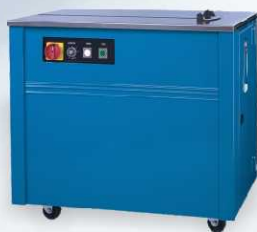
TP-201 - verze s krytým odvíječem TP-203 - zmenšený půdorys stroje na 632x422 mm