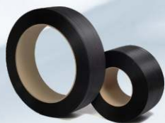
PP páska UNITAPE od výrobce UNIPACK