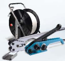
Napínák H-21 v kompletní sadě BETA 12 UNI