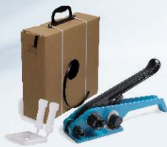
Napínák H-21 v kompletní sadě ALFA 12